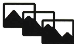
画像診断による定量的な変状把握