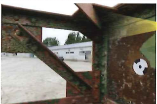
技術者の目視確認による変状把握